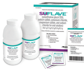
Frascos e sachês não são mostrados em tamanho real.

SUFLAVE™ (polietilenoglicol 3350, sulfato de sódio, cloro de potássio, sulfato de magnésio e cloro de sódio para solução oral) 178,7 g/7,3 g/1,12 g/0,9 g/0,5 g