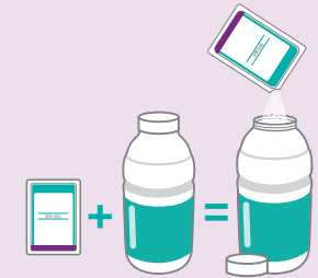
병과 패킷은 실제 크기대로 표시되지 않았습니다.